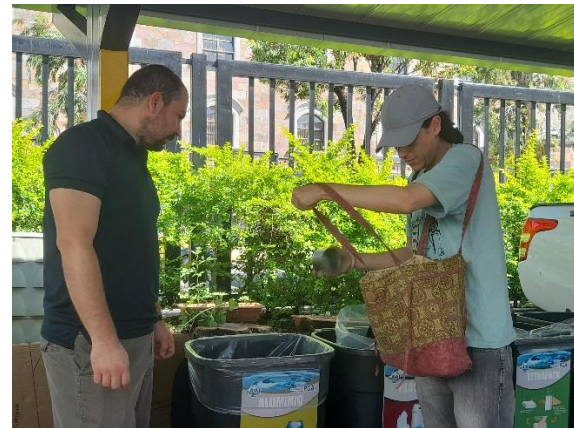
Fotografías: 1, 2, 3 y 4: Compañeros y vecinos de la comunidad participando de la campaña de recolección organizada por la UEN de Gestión Ambiental.